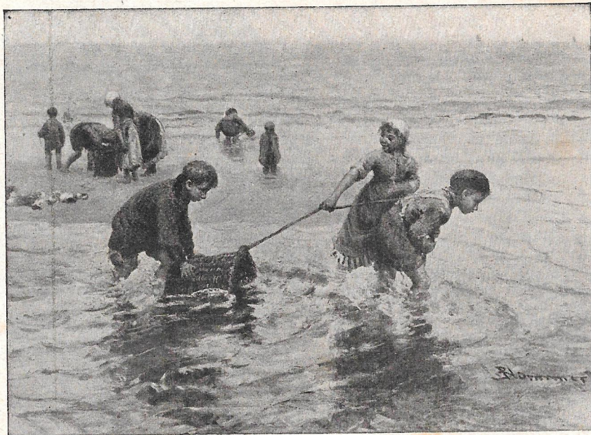
B. J. Blommers. — De kleine garnalenvisschers. Stedelijk Museum, Amsterdam.

„Ja, kind, laat de gordijnen maar neêr, dan steek ik 't licht aan.”